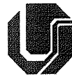
Tabela de Valores dos Serviços da Rádio Universitária: