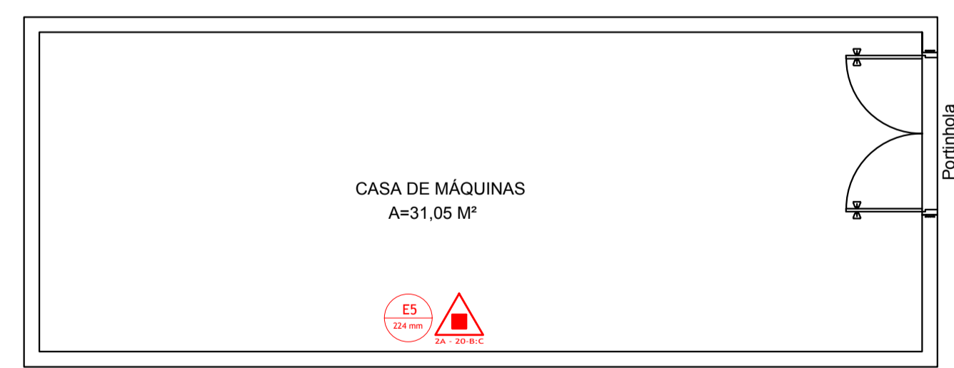
Planta Baixa CASA DE MÁQUINAS Escala 1:50

ILUMINAÇÃO DE EMERGÊNCIA NOTAS SOBRE A ILUMINAÇÃO DE EMERGÊNCIA: 1- SINALIZAÇÃO SERÁ POR APARELHO DE INDICAÇÃO LUMINOSA DO TIPO AUTÔNOMA 2- TER O NÍVEL DE ILUMINAÇÃO QUE GARANTA EFICIENTE VISIBILIDADE 3- A ILUMINAÇÃO DE EMERGÊNCIA DEVE TER FONTE ALIMENTADORA PRÓPRIA, POR BATERIA RECARREGAVEL, QUE ASSEGURE UM FUNCIONAMENTO MÍNIMO DE 2 HORAS, PARA QUANDO OCORRER FALTA DE ENERGIA ELÉTRICA NA REDE PÚBLICA 4- DEVERÁ SER FIXADA NA PAREDE EM LOCAL APROPRIADO E INDICADAS NAS PRANCHAS DE DESENHO DO PROJETO 5- DEVERÁ SER FABRICADA DE ACORDO COM AS NORMAS DA ABNT.