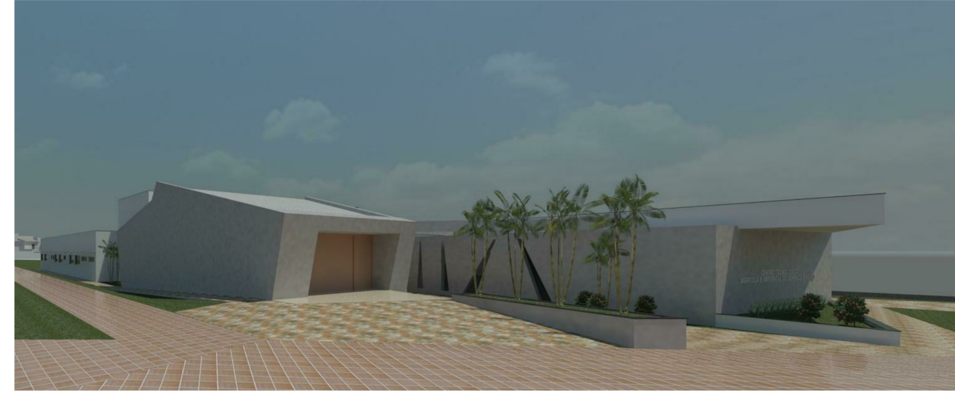
VISTA 02 3 1:1