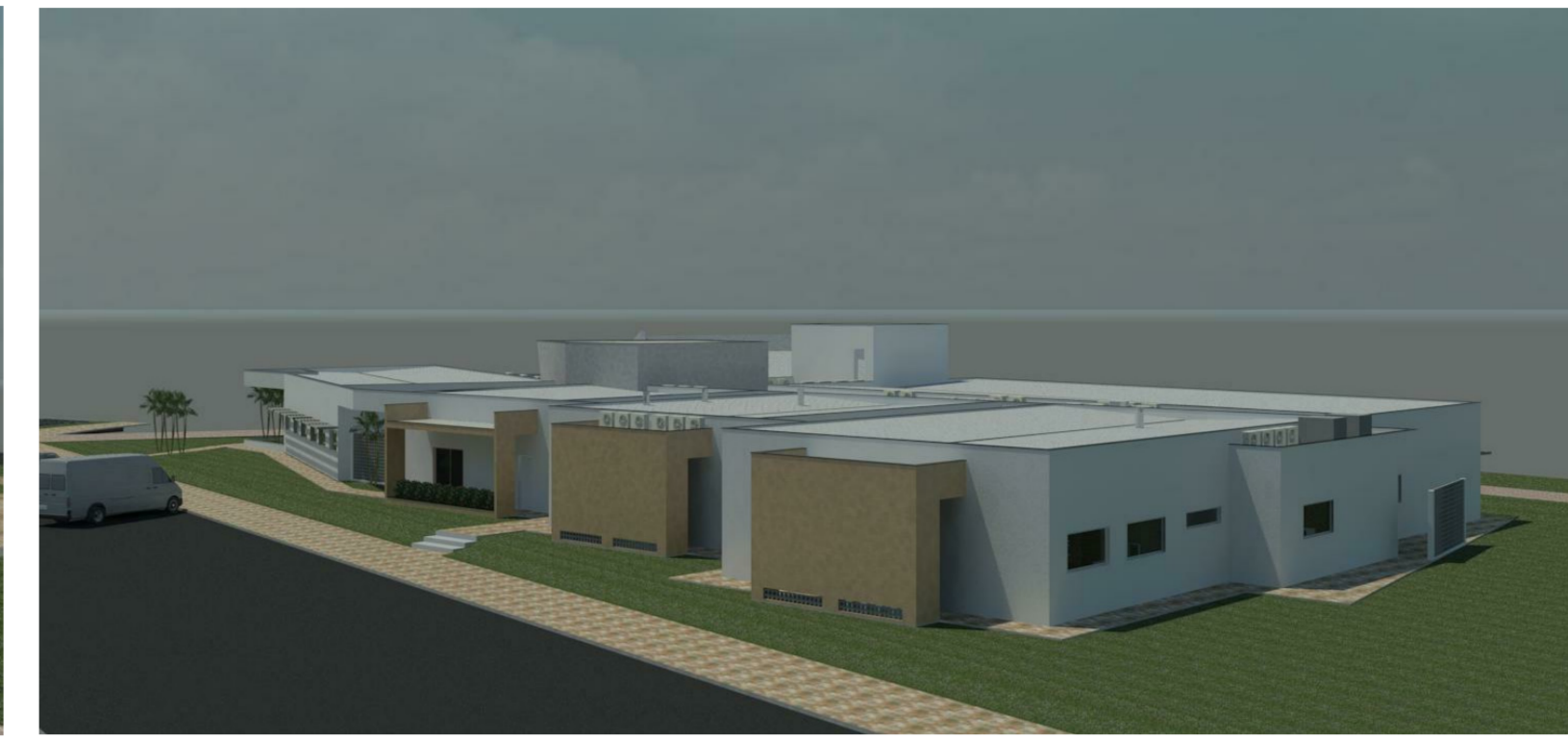
VISTA 04 5 1:1