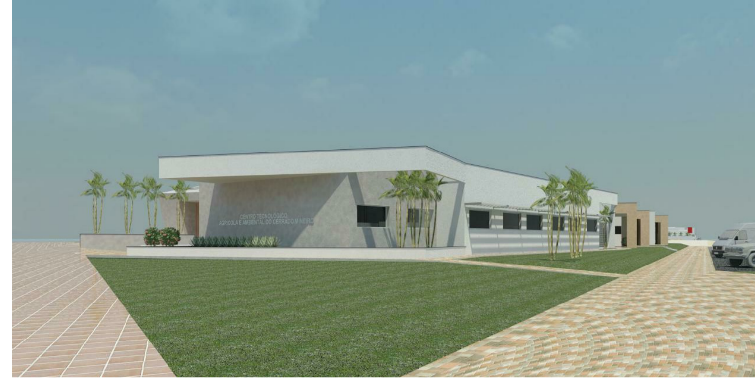
VISTA 01 2 1:1