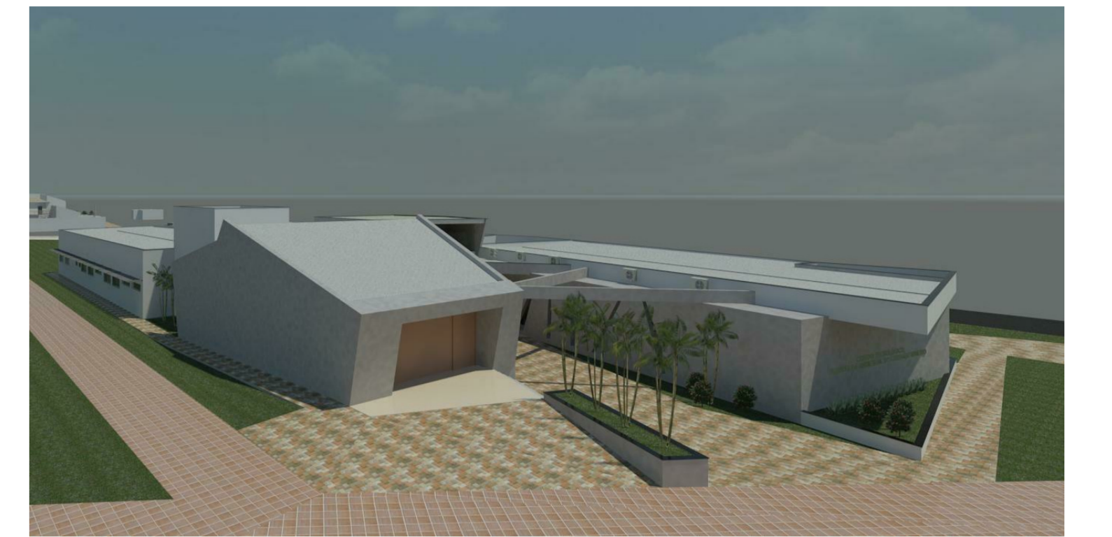
VISTA 05 6 1:1