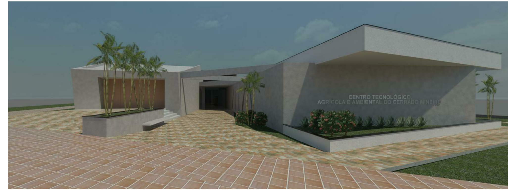
VISTA 03 4 1:1