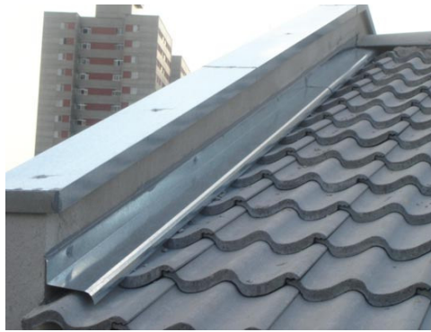
Figura 1 - Rufo instalado. Disponível em http://www.engenhariacivil.com/dicionario/rufo