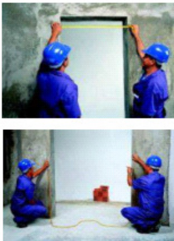
Figura 1 – Verificação de alinhamento e nível para assentamento de contramarcos. Disponível em http://professor.ucg.br/

Serão fixados com buchas e parafusos, cuja bitola e quantidade serão especificadas pelo fabricante. Poderão