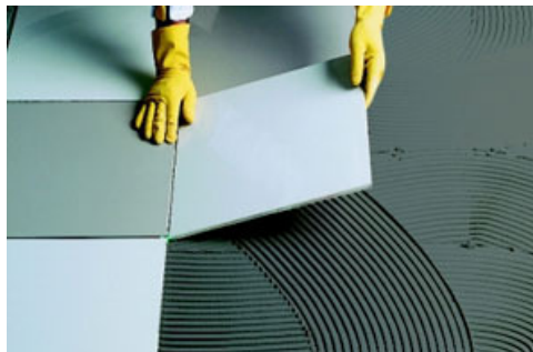
Figura 1 – Assentamento de piso cerâmico.