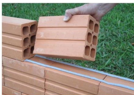
Figura 1 – Assentamento de blocos cerâmicos furados.