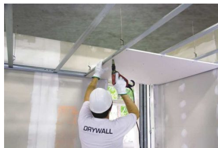
Figura 1 – Instalação de forro de gesso acartonado.