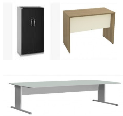
Figura 01 – Modelo de armário e bancadas em MDF. Disponível em: http://educashop.com.br/moveis/moveis-para-escritorio/ Mesa-s-gaveteiro-s-passagem-15mm-m002c160.html