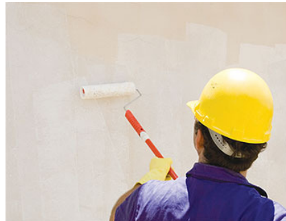
Figura 1 – Pintura de parede.