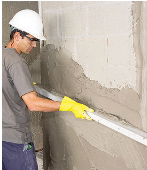
Figura 1 – Sarrafeamento de massa paulista. Disponível em http://www.pedreiro.com.br/geral/alvenarias-e-reboco/reboco-de-parede-passo-a-passo/