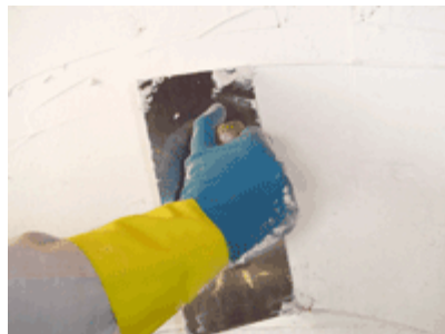
Figura 1 – Aplicação de massa acrílica niveladora.