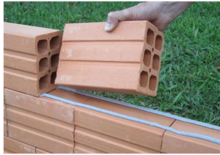
Figura 1 – Assentamento de blocos cerâmicos furados.