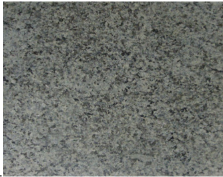
Figura 1 – granito.