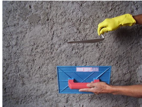
Figura 1 – Lançamento de massa para chapisco.