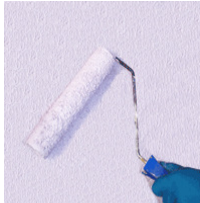
Figura 1 – Pintura de parede com rolo.