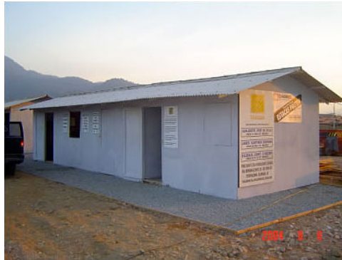
Figura 1 – Exemplo de instalação provisória de canteiro de obras.