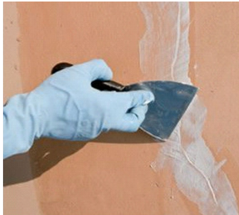
Figura 1 – Emassamento de trinca com massa corrida.