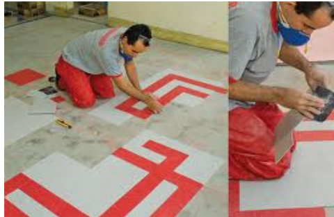
Figura 1 – colocação de piso em placa vinílica.