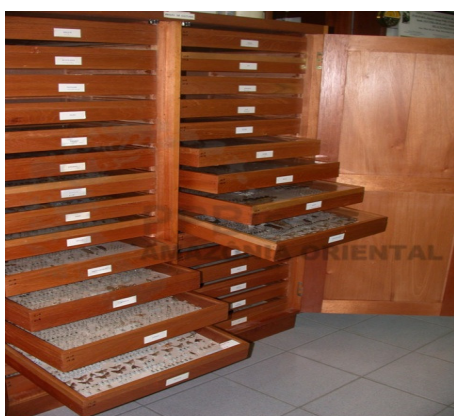
Figura 1 – Armário entomológico. Disponível em http://ppbio.museu-goeldi.br/?q=pt-br/colentomolembra