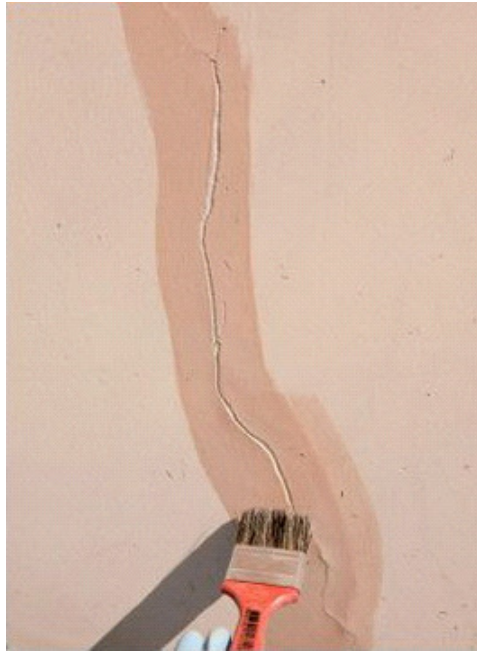
Figura 1 – Aplicação de fundo selador. Disponível em

http://equipedeobra.pini.com.br/construcao-reforma/47/artigo257605-1.aspx