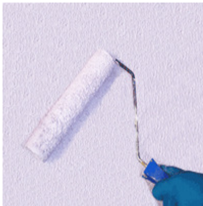
Figura 1 – Pintura de parede com rolo.