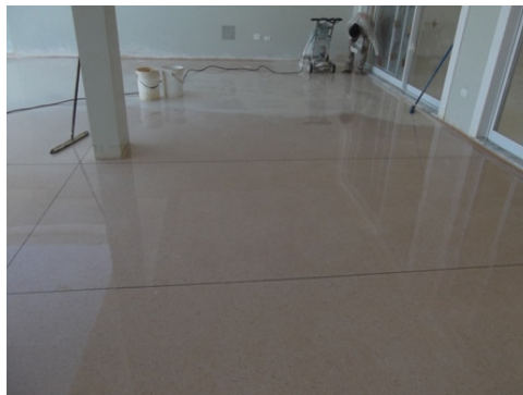
Figura 1 – Polimento de piso em granilite. Disponível em http://www.casadaspedraspisos.com.br/granilite.php