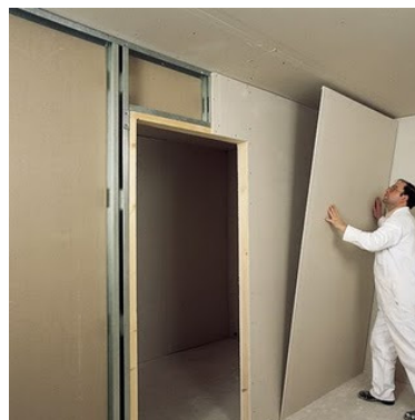
Figura 1 – fixação de painel. Disponível em http://sergiogesso.blogspot.com.br/2010/07/paredes-de-gesso-acartonado.html

Obs: Aberturas menores que 2 m 2 não serão consideradas na soma para critério de pagamento.